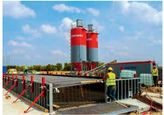
Ryc. 4. Etap szalowania fundamentów mostu

Kolumny odzwierciedlano numerycznie za pomocą modeli płytowo-słupowych. Widok jednego z modelowanych filarów wraz z mapą naprężeń pokazano na rycinie 2. Efektem finalnym projektu było oszacowanie osiadań oraz osiadań różnicowych na wzmocnionym podłożu.