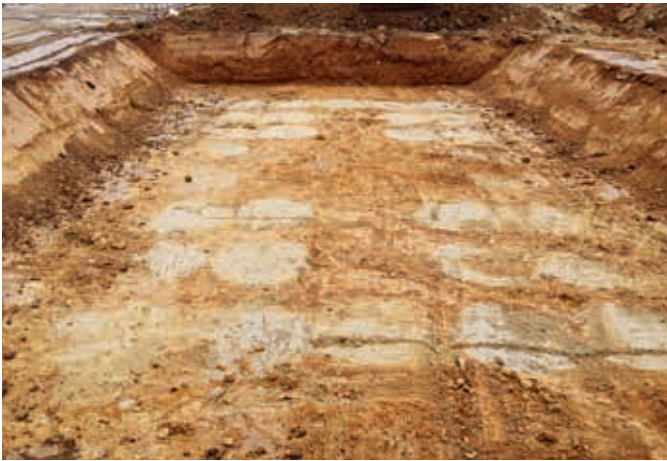
Ryc. 3. Powierzchnia pod filarem obiektu po wykonaniu kolumn DSM

1 m, a następnie wyjście o ok. 0,5 m. Sposób mieszania jest uzależniony od lokalnych warunków gruntowych, parametrów zaczynu, maszyny mieszającej. Nie można określić jednego, optymalnego sposobu mieszania, niejednokrotnie kolumnę DSM o wymaganych parametrach można uzyskać przez różne sekwencje mieszania.