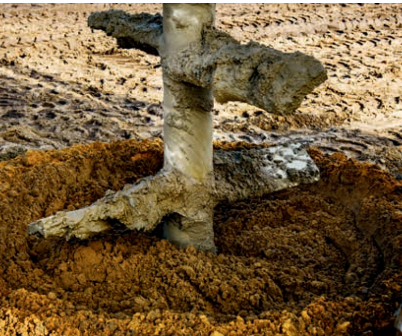
Ryc. 1. Formowanie kolumny DSM za pomocą specjalnego padła

W artykule opisano przygotowanie oraz wykonanie wzmocnienia podłoża gruntowego pod siedem obiektów mostowych (typu WD, WS, WDJ, WSJ), realizowanych w ramach zadania Zaprojektowanie i wybudowanie drogi ekspresowej S3 Legnica (A4) – Lubawka, zadanie I od węzła Legnica II (bez węzła) do węzła Jawor II (z węzłem) o długości ok. 19,730 km, tj. od km 2 + 420,47 do km 22 + 150,00.